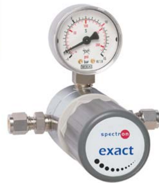
Flaschendruckregler FM 52 exact