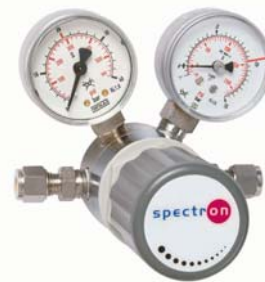
Panel-Druckregler PM52 exact